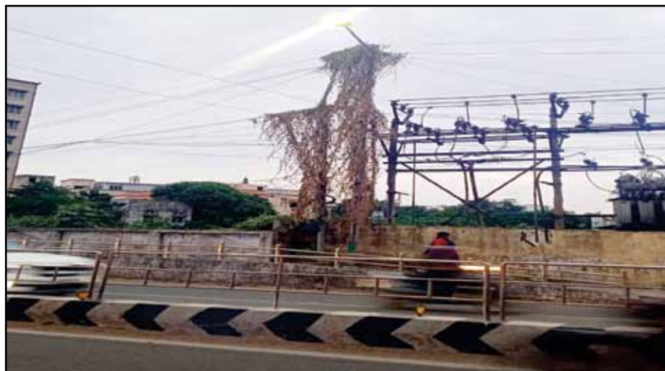
In Medavakkam Tank road near Hindustan college, Lamp post was fully covered with thin stems. It was look like a gardening. The lamp post back side bushes are also there. Concerned department need to take action.