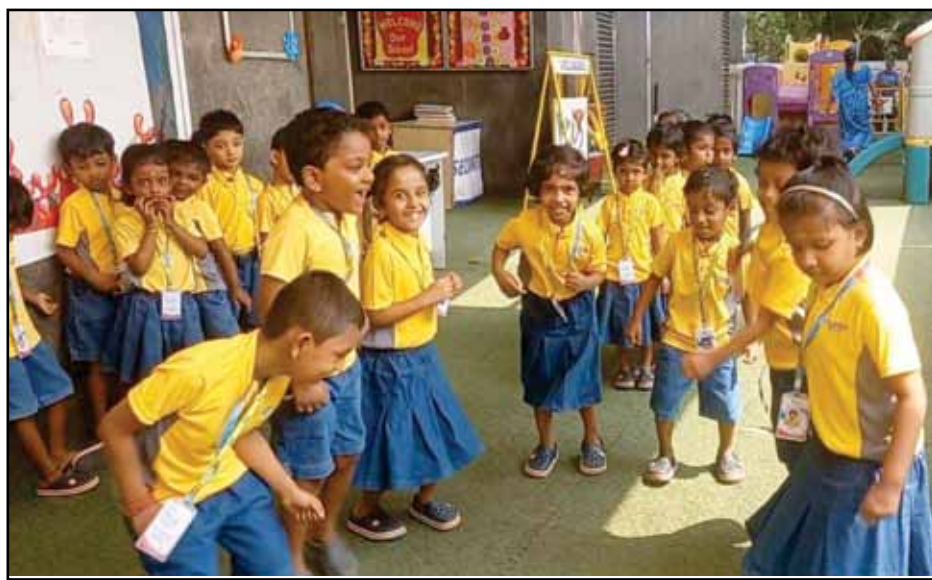
VKIDS TSK Senior Kindergarteners are started their learning through fun activities.