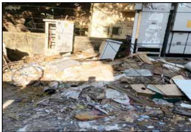
House wastes and construction wastes like doors are being disposed near the electricity pole and

transformers in W Block 1st street in Anna Nagar. This not only poses danger for the people disposing the garbage but also the ones involved in removing these garbages. Careless disposal from the public is the root cause behind this. The corporation must also take steps to install dustbins in the vicinity. This might bring the behavioral change among the people.