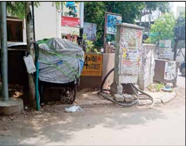
Electric cables outside found lying loose in the transformer are the street corner of

W block 4th street in Anna nagar. The wires have active current flowing through it. This makes it a dangerous zone that could cause fatal accidents. The frequency of vehicles commuting and pedestrians walking are so high that the probability of possible mishaps are very high. The EB department should take immediate steps without any delay to ensure that the people commute safely in this zone.