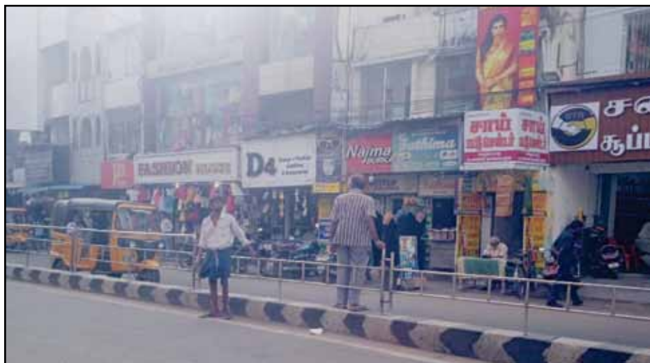
In Purasaiwalkam near csc computer coaching center, people are not crossing the road in a proper manner. It is a dangerous situation to the people.

Dangerous level crossing in Purasaiwalkam