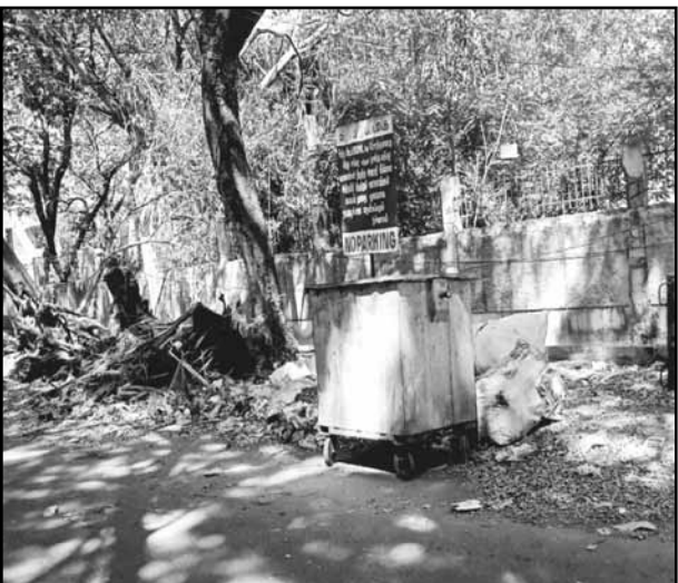
Tree wastes like broken branches and leaves and

heaps of sand and small rocks are found in the sides of Tagore circle road in Belly area of Anna nagar. These wastes are found making their way into the road. The pedestrians are finding it difficult to walk through the zone. The dustbin in the vicinity is found lying idle. Frequent inspection from the corporation is needed to avoid problems for the commuters who walk through the side walks on routine basis.