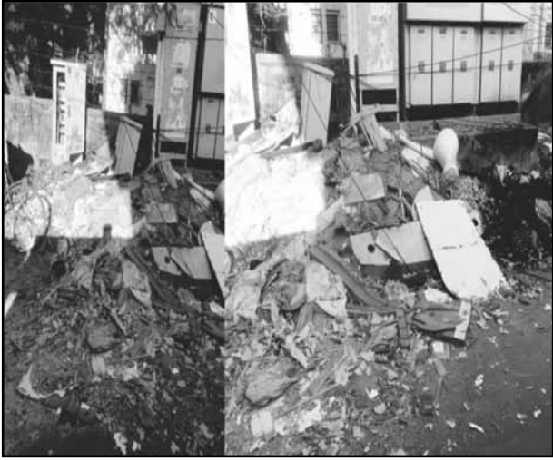
House wastes and construction wastes like doors

are being disposed near the electricity pole and transformers in W Block 1st street in Anna Nagar. This not only poses danger for the people disposing the garbage but also the ones involved in removing these garbages. Careless disposal from the public is the root cause behind this. The corporation must also take steps to install dustbins in the vicinity. This might bring the behavioral change among the people.