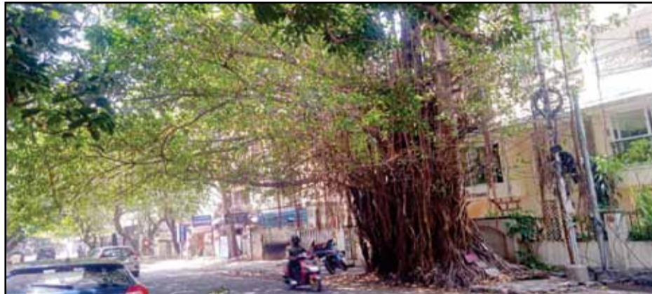
Old banyan tree more than 40yrs at London's road kilapuk