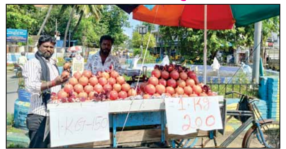
Fresh Pomegranate at Per Kg Rs.150 to Rs.200 range, people are eagerly to buy the fruit. Available at near St. Paul Chruch @ Choolai.

Fresh Pomegranate at lowest price, near CSI St. Paul Chruch @ Choolai