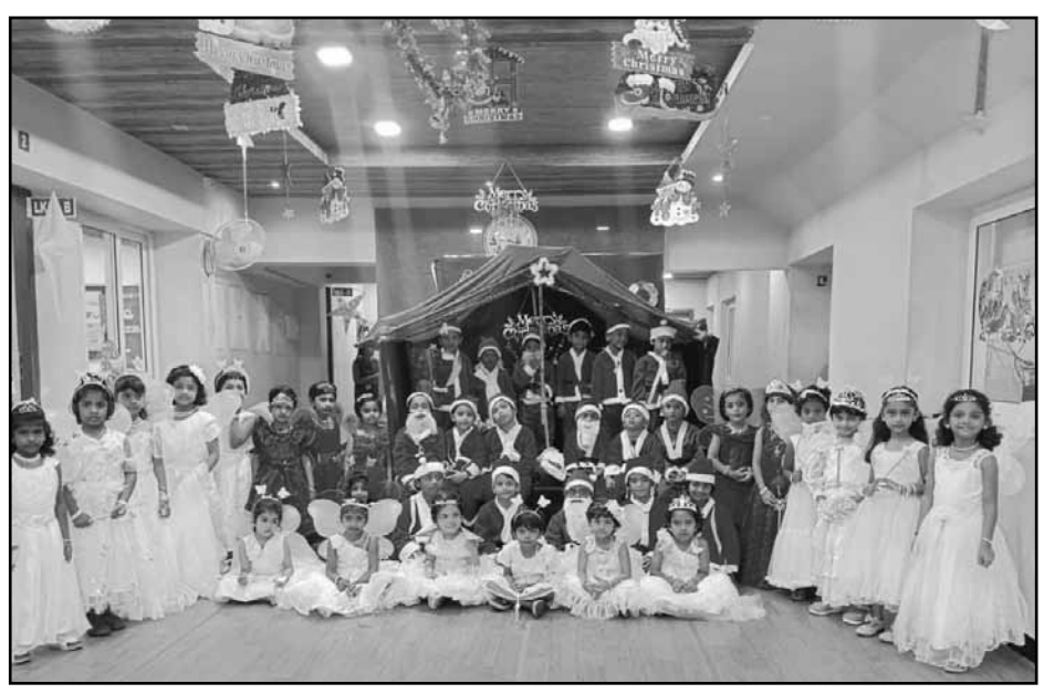
VKIDS TSK celebrated Christmas Celebration joyfully along with nativity and Christmas Carols.