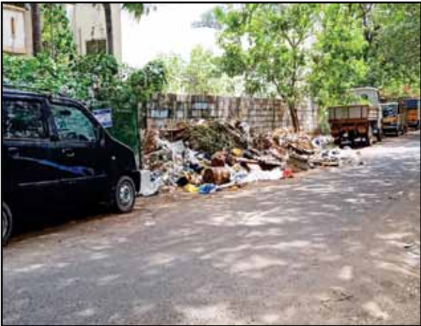
Wet and dry tree wastes are found along the platforms and sides of the road of D block,

8th street in kilpauk. Dumpings are so haywire that the dustbins that are around are neglected and the garbages are hastily thrown around the road. Regular clearing of wastes by the corporation coupled with behavioral change among the people to drop the garbage in the dustbin is the need of the hour.