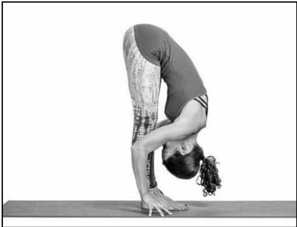
Standing forward bend How to do the pose: Reach tall and exhale

forward, then bend knees enough to be able to place your